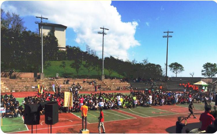
佛大十五周年校慶運動會