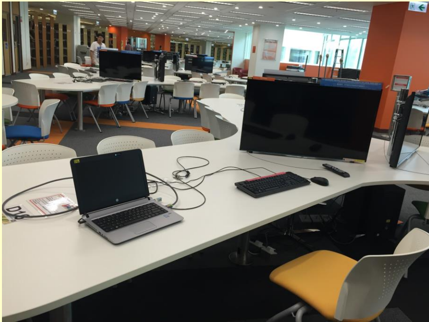
圖書館的小組討論區