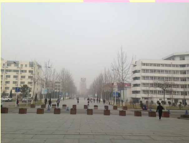
霧是帝都厚，霾是煙台醇