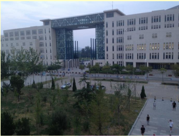
校園一景。 左為綜合樓，是教室教學樓。 右為逸夫圖書館。