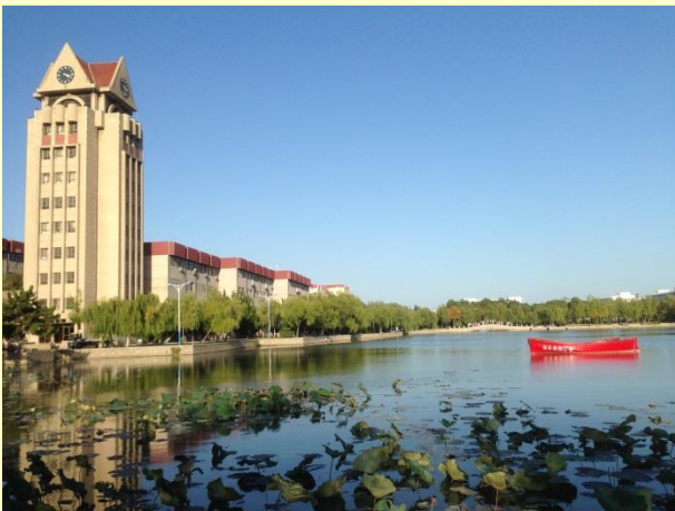
校園一景-三元湖 一年四季都有不同景色。 圖為9月