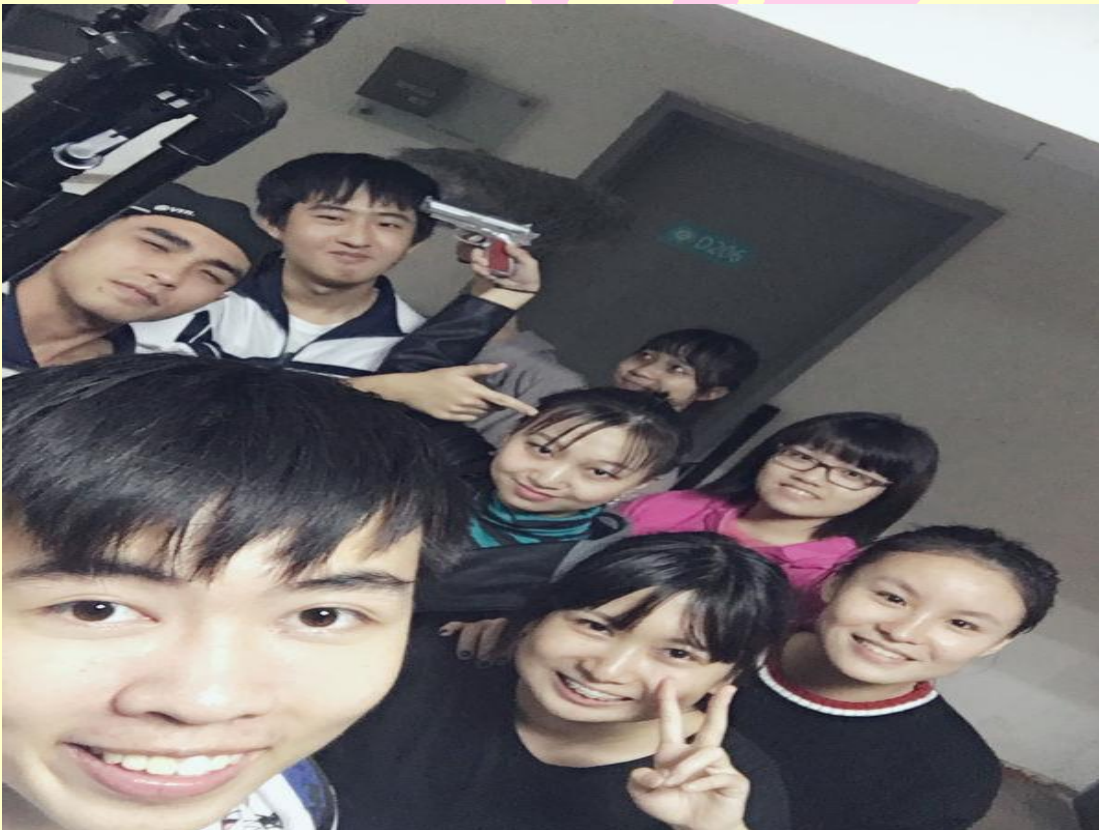
和社團一起拍攝影片