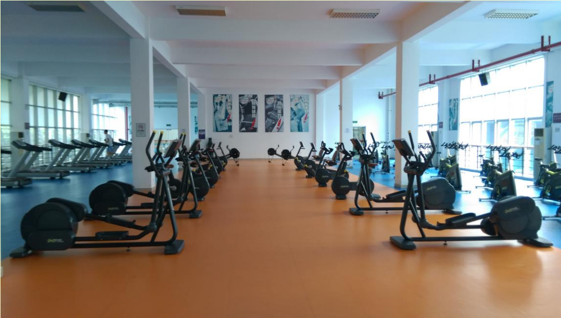
南區體育館健身房