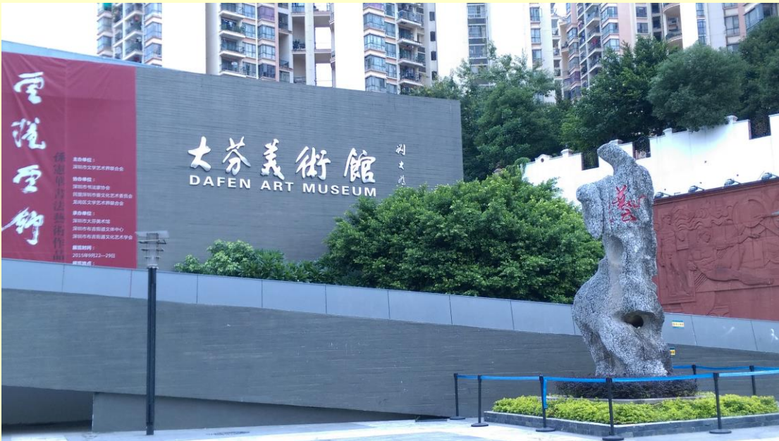
到大芬油畫村參觀