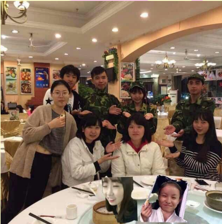
這是在回台灣前A D C公益社團傳媒部一起吃飯歡送我