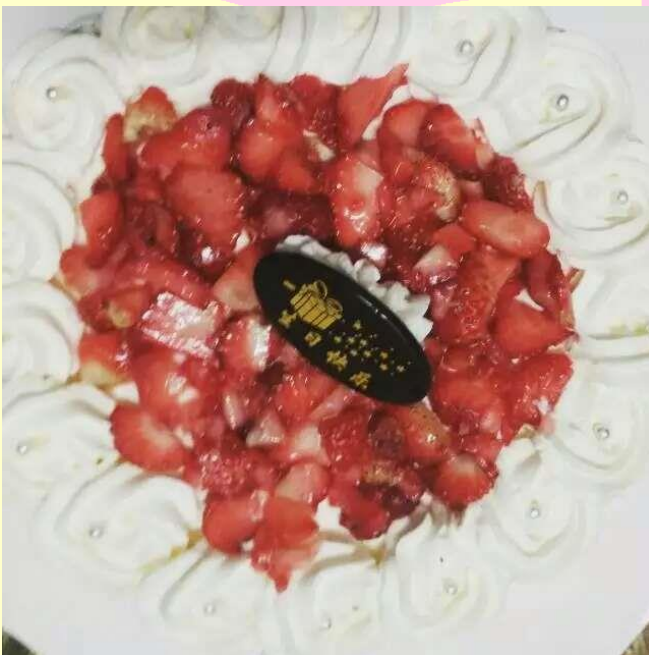
幫我過生日的室友們