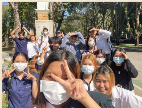
與泰國學生闖蕩校園

組內的大環境，我希望需要開始的一對一溝通能力，謝謝老師能夠給我們彼此這個機會，因為這方面的訓練，所以我很感激。我們在泰國的學習過程，因為這方面的訓練，所以我很感激。我們在泰國的學習過程，因為這方面的訓練，所以我很感激。