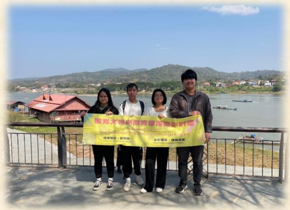
來到緬甸、泰國及寮國的黃金三角交界處