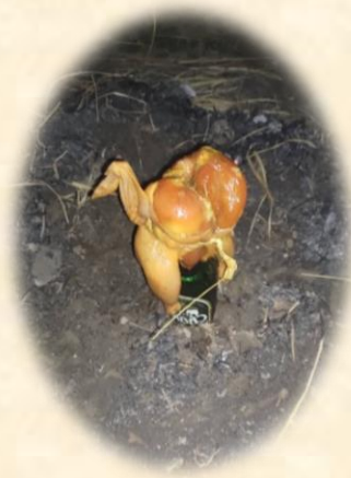
營火晚會以及手製悶雞