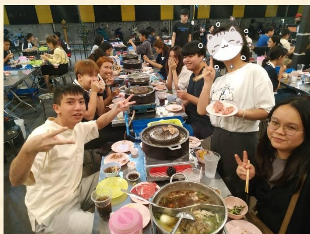
在泰國認識到的好朋友們