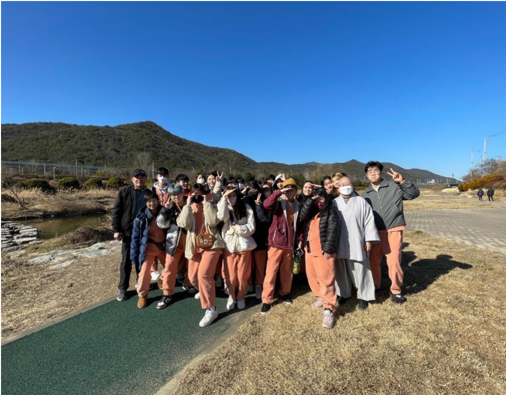
第三天弘法寺元宵節