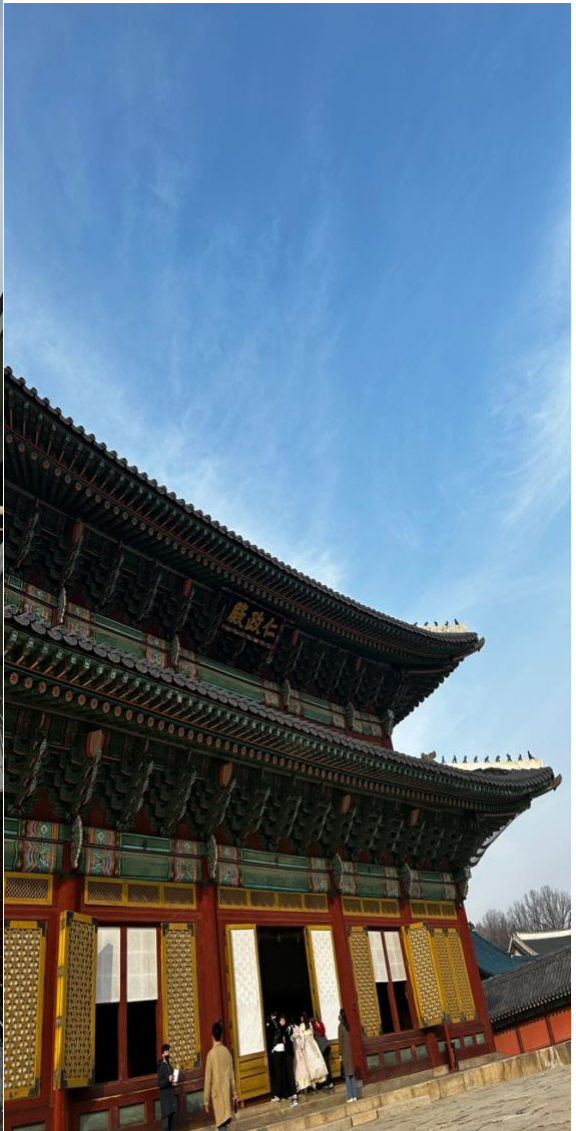
第五天北村韓屋村、昌德宮、樂天塔