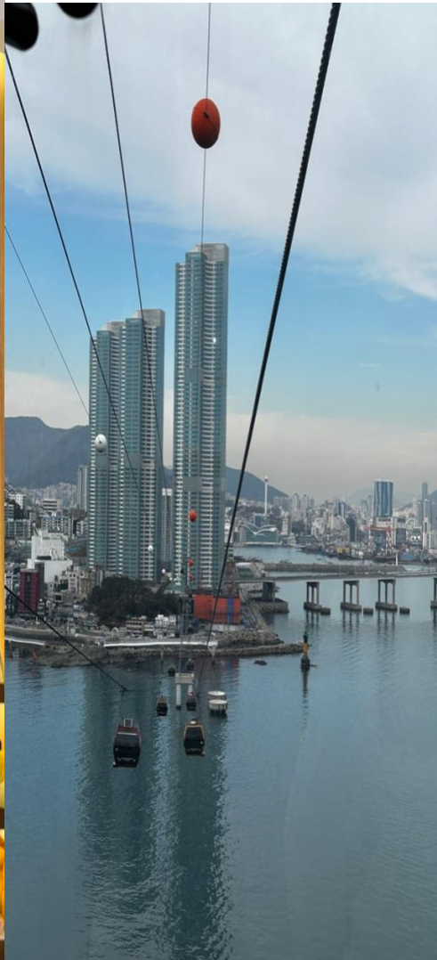
↖ 第四天富平市場、松島海上纜車