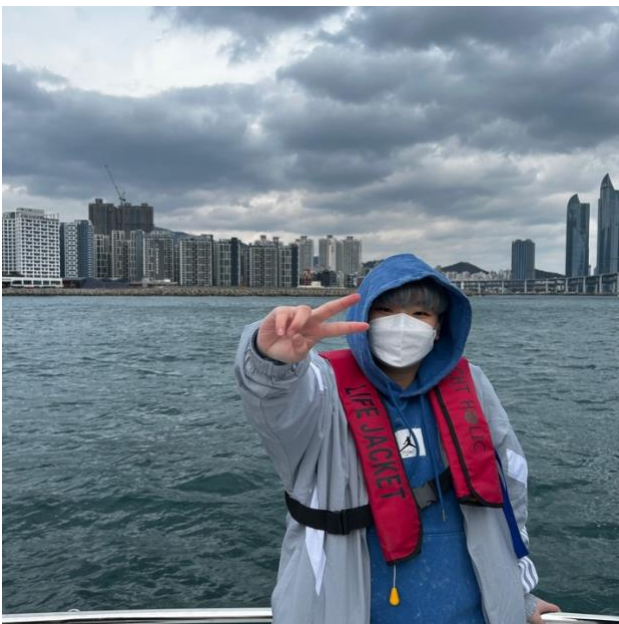
↖ 第七天新世界 SPA LAND、海雲台搭遊