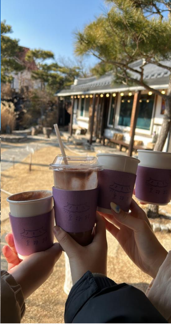
第二天通度寺、咖啡廳