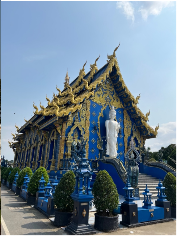
這是清萊的白廟和藍廟，非常值得來參觀